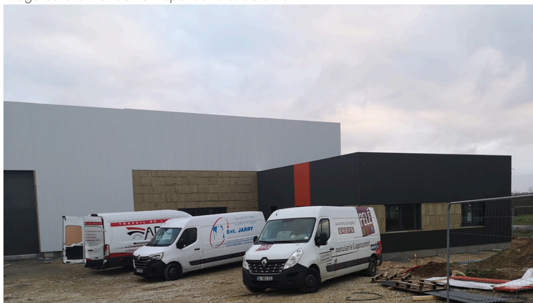
© Cynthia Bréhin - Laval Économie