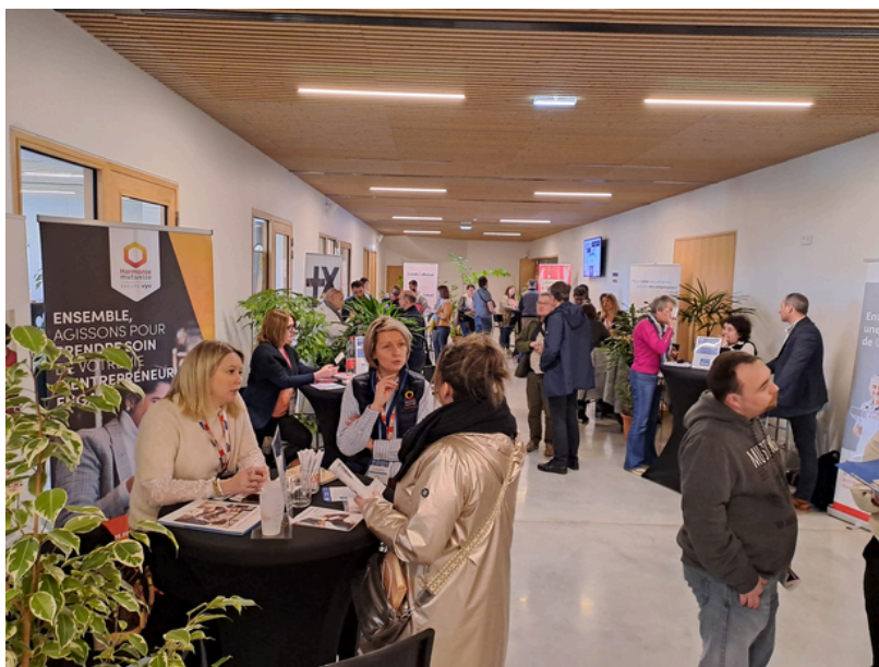
La Grande Aventure Entreprendre

Le territoire de Laval Agglomération reste un territoire qui crée des entreprises.