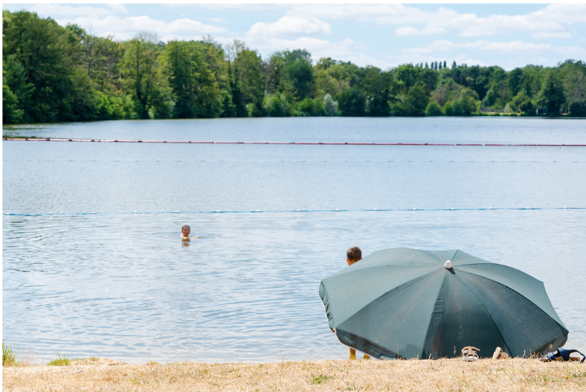
Plan d'eau d'Argentré

Pour le secteur du tourisme, Laval Agglomération reste dans la moyenne des autres territoires en termes d'hôtels, de chambres et d'hôtels étoilés. En revanche, le nombre d'emplacement de camping est nettement inférieur.