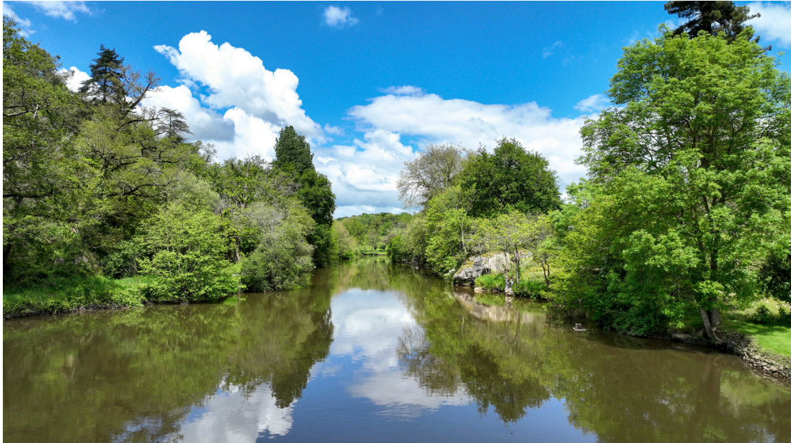
La rivière Mayenne

Laval Agglomération, en comparaison à d'autres territoire, a des points forts, il faut notamment citer l'économie en termes d'emplois, de sociétés créées (à mettre tout de même en parallèle aux sociétés radiées). La culture est aussi un atout et bien développé sur le territoire de Laval Agglomération.