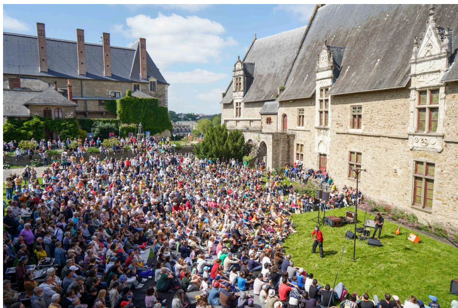
Les 3 Éléphants

C'est deux éléments sont importants pour l'accueil de nouveaux actifs sur notre territoire, en effet, à côté de la vie professionnelle, des équipements pour la vie personnelle est primordial.