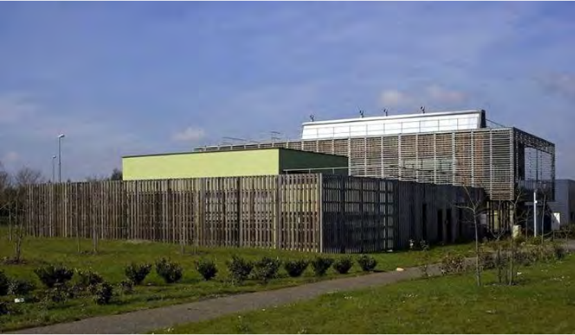
Principe d'espace technique masqué par une « double-peau » (structure métallique / bardage bois à claire-voie)

> Stockage extérieur de matériaux visibles depuis l'espace public ou « espaces techniques » qui devront être masqués soit par un élément architectural en cohérence avec le bâtiment principal, soit par une haie arbustive et/ou arborée suffisamment dense et haute.